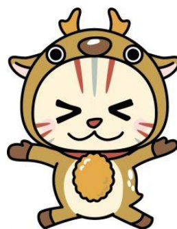
小鹿野町公式ご当地キャラクター おがニャッピー