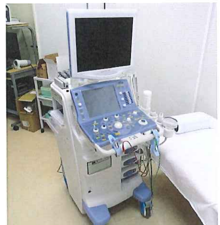
超音波診断装置プロサウンドα7

心臓には4つの部屋がありますが、その大きさや壁の厚さに異常はないか、動きは悪くないか、また、部屋の間にある弁に異常はないか（形や動きなど）などをみて、心臓の病気の診断に役立つ検査です。