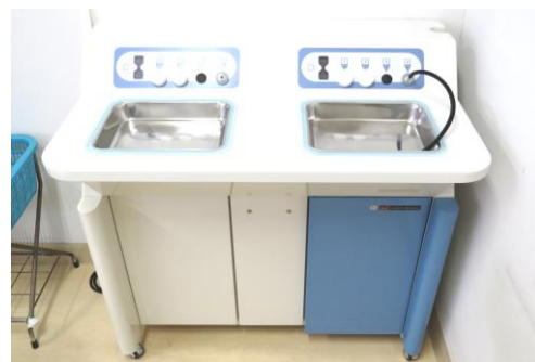
ネプライザー(吸入器)

大腸ビデオスコープは、今回購入し同じ機能が備わった最新装置が2台になり、待ち時間も少なくなり効率的で快適な検査ができるようになりました。