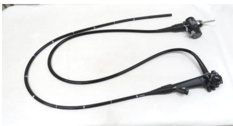
大腸ビデオスコープ

病院では、皆様に快適で安全な医療が提供できるよう、毎年最新式の医療機器を導入し、医療の充実を図り皆様に喜ばれる病院づくりに取り組んで参りますので宜しくお願いいたします。