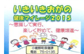
ポイントカード見本

※ご予約・お問い合わせ先:総合健診センター(病院内)Tel72-7510(直通)