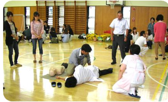
長若小学校 【出前講座】 長若小学校の保護者の皆さんと先生で、水難事故に備えて心肺蘇生法の勉強をしました。

長寿ハウス 【出前講座】 腰痛にならないためには、ロコトシを始めましょう。生活習慣病にならないようにするには塩分を抑えた方が良いでしょう。