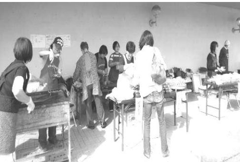
各団体で模擬店を出店