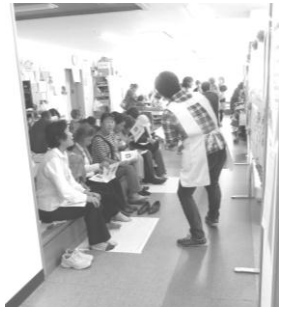
リハ室：フットケア

また、病院職員・町の保健福祉職員とのふれあいの場にしていただければと思います。皆さんに来て喜んでいただけるように、様々な催しを計画しております。