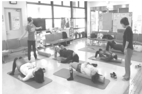
病院ロビー：ポールストレッチ