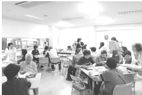
食堂：減塩食の試食の様